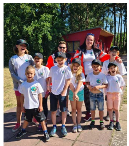
Mit viel Spaß auf dem Parcours unterwegs

Unser Jugendrotkreuz trifft sich immer dienstags zwischen 16.30 Uhr und 18.00 Uhr im DRK Kreisverband Brandenburg an der Havel e.V., Grüne Aue 6, 14776 Brandenburg an der Havel.