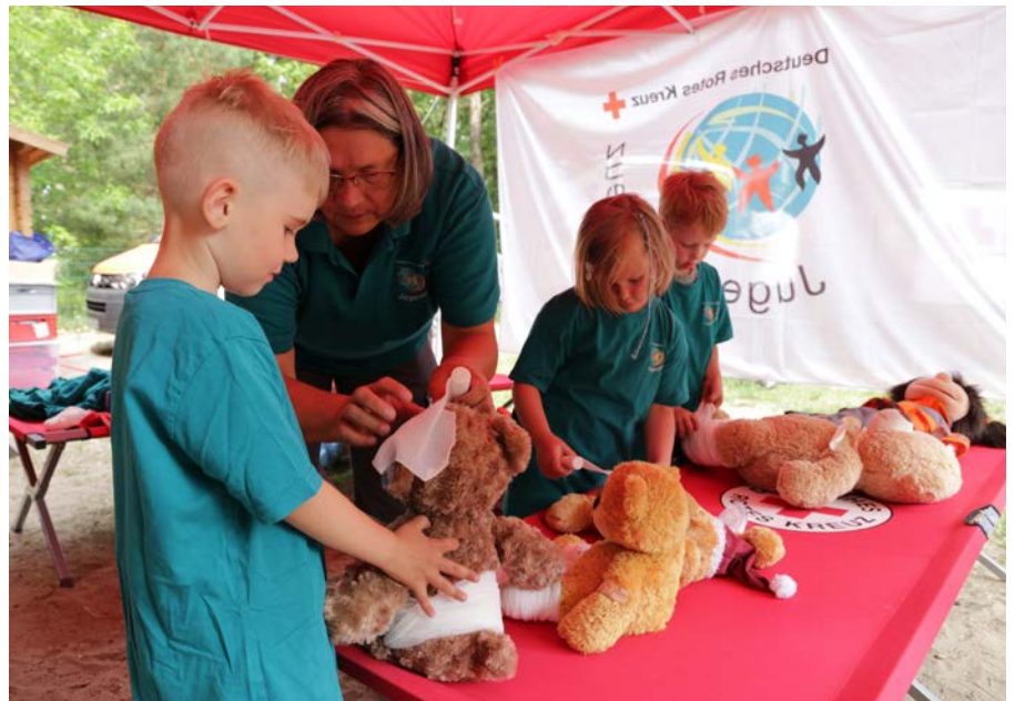
Gelebtes Rotes Kreuz: In der DRK-Kita „Wasserwichtel“ in Erkner (KV Märkisch-Oder-Havel-Spree) kommen die Kinder schon früh in Kontakt mit dem Jugendrotkreuz.

Ein Beispiel für das Profilelement „Verknüpfung von Haupt- und Ehrenamt“ ist die Integration des Jugendrotkreuzes in den Kita-Alltag: Die Kinder erhalten so frühzeitig den Zugang zu zivilgesellschaftlichem Engagement.